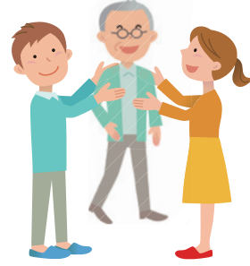
八街市の将来人口推計

このような状況の中で、住み続けたいと思える街にするためには、 八街市に関わるすべての人々がふれあい、つながり、支え合ってまちづくりに取り組むことで、それぞれが活躍し、生きがいを感じられる地域社会を築いていく 必要があります。