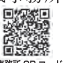
成田地域事務所 QRコード

記号の見方 時 日時 会場 内容 対象 定員 費用 用 申し込み 締め切り 持ち物 問い合わせ FAX 444・0815