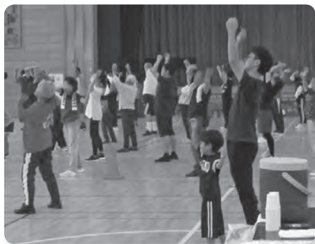
レクリエーション交流会

活動を開始したところですが、88歳以上の方の誕生日に記念品などを贈り祝福しています。また、実住中央地区社会福祉協議会と連携して、高齢者向けのシルバー健康サロン、敬老会、チャリティーパークゴルフ大会といった事業を通じて地域の交流を深めています。 現在、六区にある八街神社は、明治27年までは、四区内の千葉黎明高等学校の北側の山林中にありました。八街神社は、埼玉県さいたま市にある氷川神社から分霊し、明治5年に創建されたと言われています。このような歴史から、当時の八街神社は「氷川様」と呼ばれ、神社があった場所を「氷川台」、その神社に通じる道は「氷川小路(ひかわこうじ)」などと名付けられました。現在でも地名として残っています。