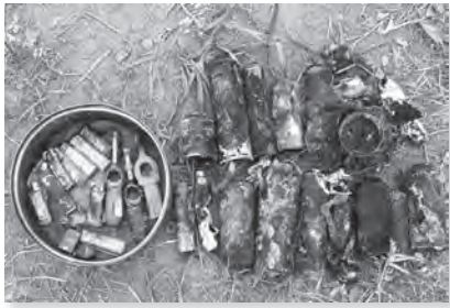
出火元と推定されるスプレー缶やガスライター