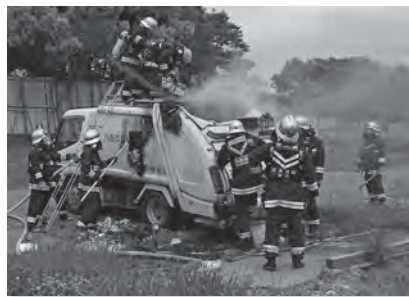
消火活動中の様子

ガスが残ったスプレー缶やライター、乾電池などが正しく分別されなかったことにより、ごみ収集車の火災が発生しました。