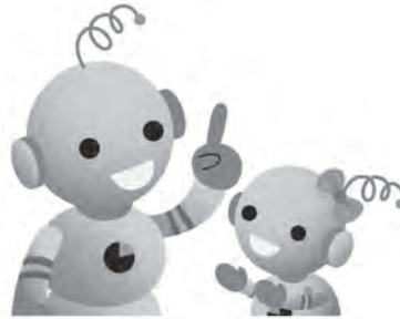
工業統計キャラクター コウちゃん・コウミちゃん

調査結果は、国や地方公共団体の行政施策の重要な基礎資料として利用されるところにも、企業、大学などでの研究