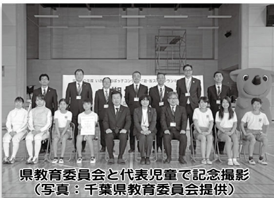
県教育委員会と代表児童で記念撮影

千葉県教育委員会では、8つの運動種目に取り組む『遊・友スポーツランキングちば』を実施しており、中期（7月～11月）に参加した県内142校のうち積極的に取り組んだ朝陽小学校が平成30年12月13日（木）に表彰されました。表彰後は、トップアスリート交流会が行われ、東京オリンピックに向けて練習に励んでいるフェンシング選手が来校しました。ほとんどの児童が、フェンシングを見るのが初めてで、動きの速さや迫力に圧倒されていました。