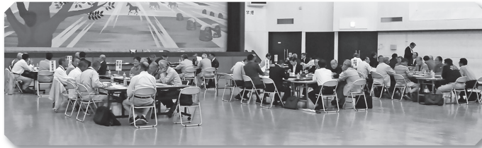
◀9月21日(金)中央公民館で行われた区長・区長代理者による意見交換会の様子

市内39地区の区長が年に数回集まり、区長会議や意見交換会を開催して課題の共有や情報交換を行っています。また、各区長は地域と行政とのつなぎ役として、回覧物の受け取りや地域住民の要望のとりまとめなどを行い、よりよい区の運営に努めています。