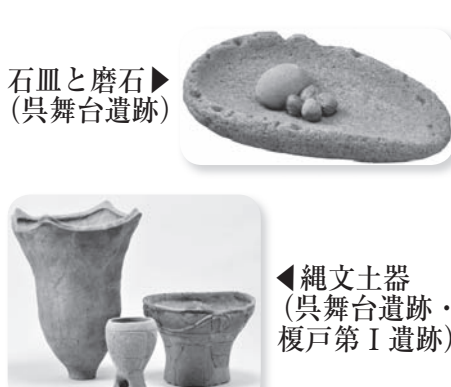
石皿と磨石(呉舞台遺跡) 縄文土器(呉舞台遺跡) 縄文土器(呉舞台遺跡)

八街市は、印旛沼水系と九十九里水系の分水界に位置する市で、遺跡の分布数は少ないものの、各時代において、貴重な資料が出土しています。今回は、千葉市加曾利貝塚が特別史跡に指定されたことに伴い、縄文時代中期の企画展を開催します。