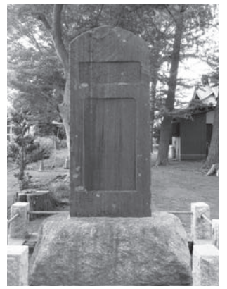
山田台烏森稲荷神社「慰霊碑」

西南戦争以降、日本はいくつもの戦争を経験してきまし... 八街からも多くの人が応召され戦地へ赴きました。日本へ帰還した人々の一方で、戦地で亡くなった人々も多くいます。