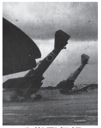
八街飛行場

太平洋戦争が始まる前の昭和16(1941)年3月、旧日本陸軍は「陸軍下志津飛行学校八街分教場」(通称・八街飛行場)を現在の八街市朝日区と富里市四区のおよそ3.5町歩(約3.35km)に開設しました。この飛行場は、戦時における空中偵察や情報収集の教育・訓練を行う軍学校の一つでした。そして、この飛行場には時速600kmで飛行を可能とする当時の最新鋭であった陸軍百式司令部偵察機を配備しました。