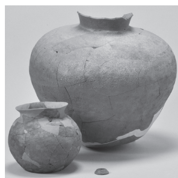
かわらめき1号墳出土遺物