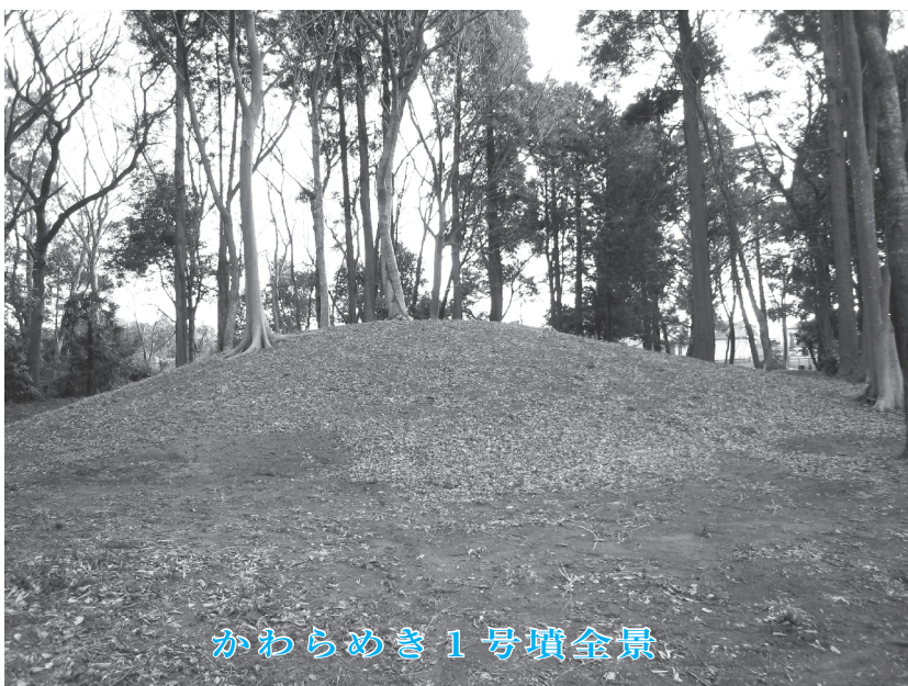
かわらめき1号墳全景

かりました。かわらめき古墳群は、出土した土器から4世紀後半から5世紀中頃にかけて造られた古墳であることが明らかになりました。また、須恵器大甕は、胎土（たいど）分析の結果、大阪府の陶邑（すえむら）で生産された製品であり、遠くはるばる八街の地へ持ち込まれたことが明らかとなりました。これらの出土品は、市郷土資料館に常設で展示されています。