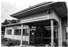
▲南部地域包括支援センター

市長 南部地域の山田台郵便局及び本庁でのご利用をお願いしたいと考えております。今後については、市全体