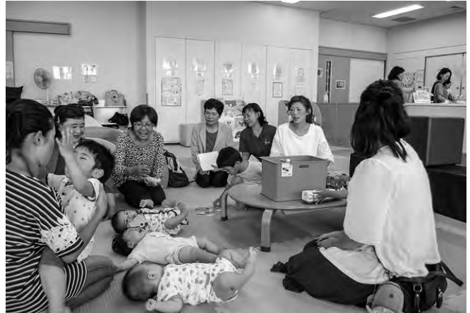
▲お友達たくさん！みんな仲よし！