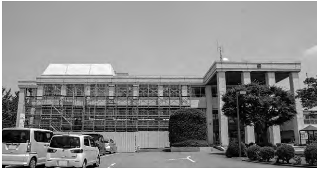
▲耐震補強工事が始まる市役所第1庁舎