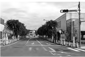
▲八街駅北口のケヤキ並木

植栽マスの盛り上がり も確認され、将来、歩道 の通行にも支障をきたすことも予 想されます ので、沿道 の地区とも 調整を図り ながら検討 します。