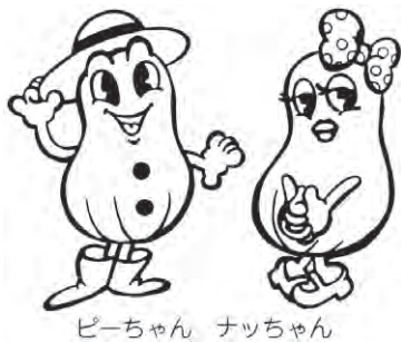
ピーちゃん ナツちゃん