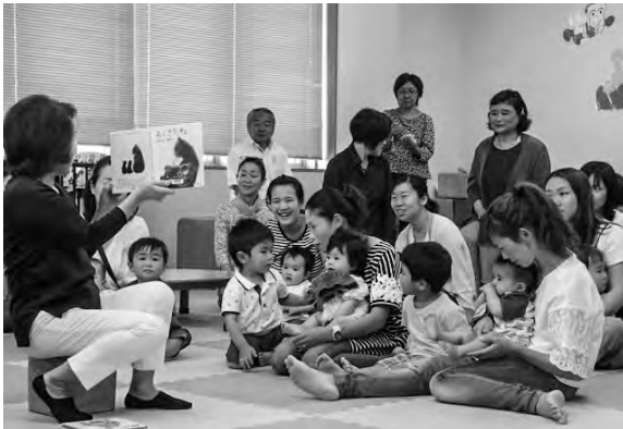
▲ボランティアグループ おはなしの会「おひさまはらっぱ」による、おはなし会の様子