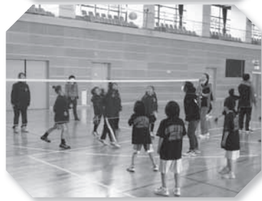
ニュースポーツ体験大会

また、3月11日(日)に、スポーツプラザで、ニュースポーツ体験大会が開催されました。参加者35人が、ラージボールテニス・バドミントン・室内ペタンク・ミニバレー・ふわどっち・健康体操を体験し、体を動かすことのすばらしさを体感しました。