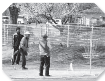
ディスクゴルフ大会

3月4日(日)、スポーツプラザでディスクゴルフ大会が行われました。子どもから大人まで16人の参加者が5組に分かれ、9つのホールに挑戦しました。