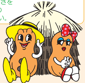
八街市イメージキャラクター「ピーちゃん、ナッツちゃん」©八街市