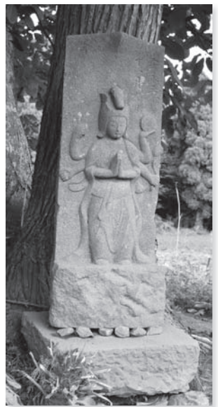
岡田馬頭観世音職

八街市内には、村の人々のさまざまな信仰によって建立された石造物が多数残されています。なかでも、八街市域には、柳沢牧と小間子牧という馬の牧場が所在していたため、馬頭観世音が祀られていることが多く、江戸時代から現在までに馬頭観世音が5基も建立されています。