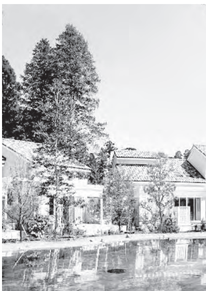
小谷流の里 ドキーズアイランド

男女の出会いのきっかけとなる場をつくり、八街市の活性化を図ることを目的として、婚活イベントを実施します。真剣に交際や結婚について考えている方、ぜひ、ご参加ください。