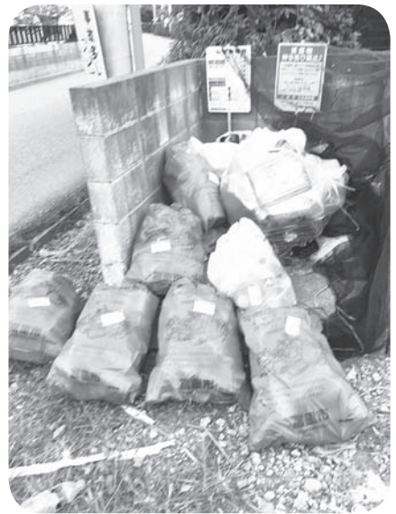
《ごみステーションに