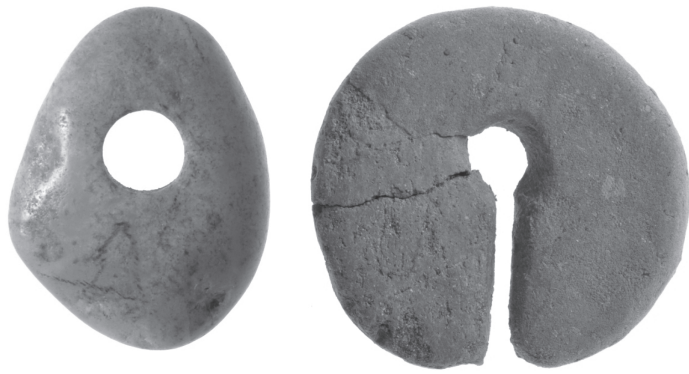
ヒスイ製垂飾 土製けつ状耳飾り