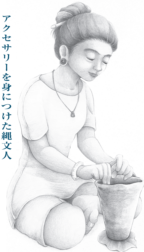
アクセサリーを身につけた縄文人