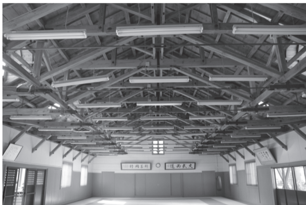
▷生徒館内部の木造トラス構造

で、現在も授業や部活動等に使用され、良好に維持されています。建物は、校地のほぼ中央に建つ東西に長い木造平屋建です。屋根は鉄板葺で、両妻を半切妻として大小10のドーマー窓を並べ、外壁は下見板張としています。小屋組は、下弦をターンバックルで緊張させた独特な形式の木造トラスを組んでおり、美しく壮観です。この建造物は、大正期の八街の景観を伝える近代洋風建築物として貴重であり、