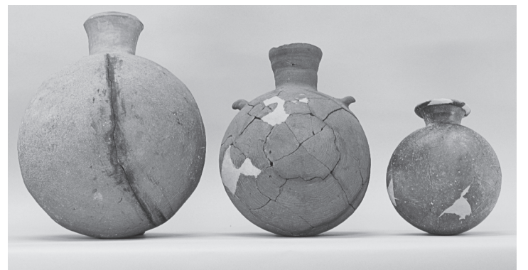
魔拝塚古墳出土提瓶