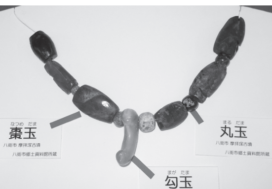
魔拝塚古墳出土アクセサリー

スポーツプラザを造る際に、6世紀中頃〜後半に造られた宮前古墳と魔拝塚(さいはいづか)古墳の2基の古墳が発見されました。宮前古墳は、墳丘主軸長25・7mの帆立貝型前方後円墳で、埋葬施設は筑波山から運び込まれた点紋黒雲母粘板岩(てんもんくろうんもねんばんがん)を組み立てて作った箱式石棺です。出土遺物には、土師器杯(はじきつき)、須恵器埴(すえきていへい)、人骨、鉄製直刀(ちよくと)などがあります。魔拝塚古墳は、墳丘主軸