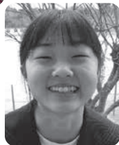
八街南中学校 はなさん (1年)

八街中央中学校では、台湾とオンラインで国際交流を行い、中央中が昨年より取り組んでいるSDGsについて発表しました。また、街頭募金の活動も行いました。これらの取り組みから、人との関わり大切さを学びました。