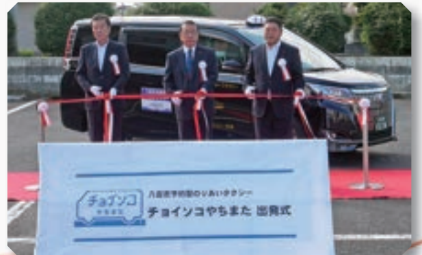
予約型のりあいタクシー「チョイソコやちまた」出発式(令和5年10月2日)