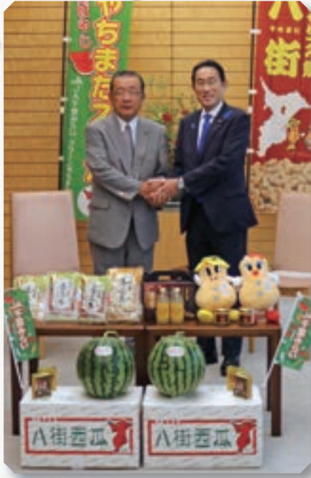
岸田総理に落花生をPR(令和5年7月20日)