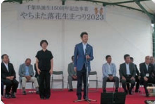
やちまた落花生まつり2023に千葉県知事の熊谷氏が来場(令和5年9月17日)

人口の動き 12月1日現在 人口66,995人(前月比-132人) 男34,384人女32,611人世帯数32,808世帯