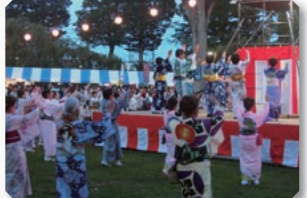
第32回八街ふれあい夏まつり(令和5年8月19日)