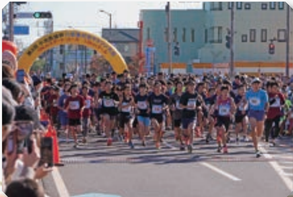
第3回小出義雄杯八街落花生マラソン大会(令和5年10月22日)