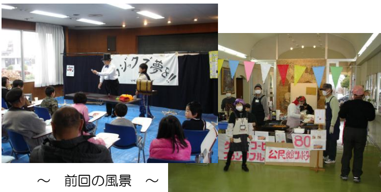
～ 前回の風景 ～