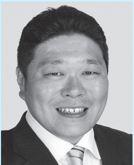
山口 孝弘 議長