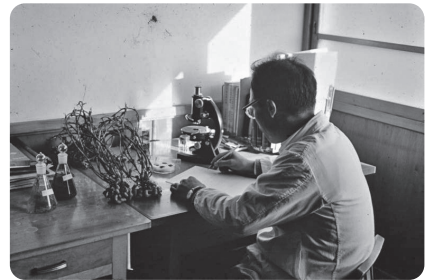
落花生の品質調査 (昭和30年代)