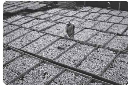
落花生を干す (昭和30年代)