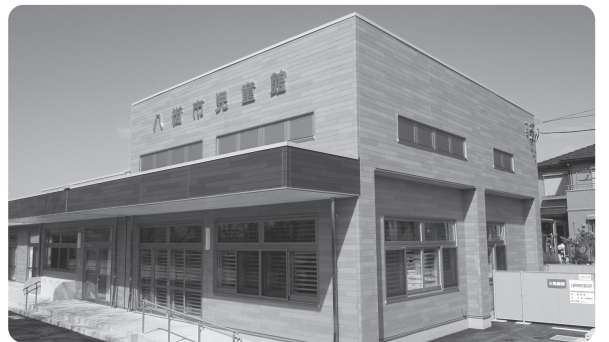
皆さんの貴重な税金を活用し建設された児童館

市では、消費者金融ローンやクレジットカードなどの返済が重く、税金の納付が思うようにできない方、借金が大きいため個人再生・任意整理、自己破産などを検討中の方で市税などを滞納している方を対象に、弁護士による無料相談を実施しています。