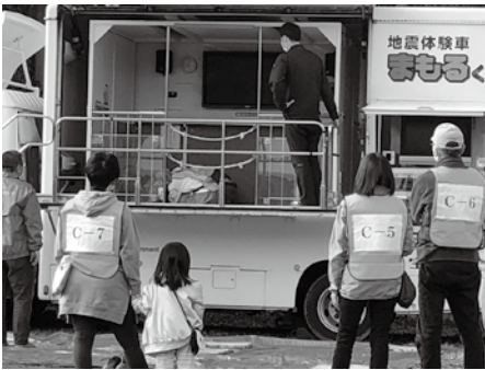
ガーデンタウン防災フェスタ2021 「地震体験車による震度7体験」