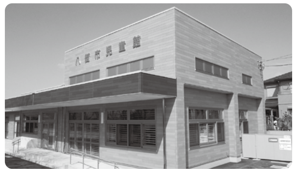
皆さんの貴重な税金を活用し建設された児童館

また、仕事などで平日業務時間内の納税相談や納付に来られない方のために、日曜開庁や夜間窓口を開設しています。