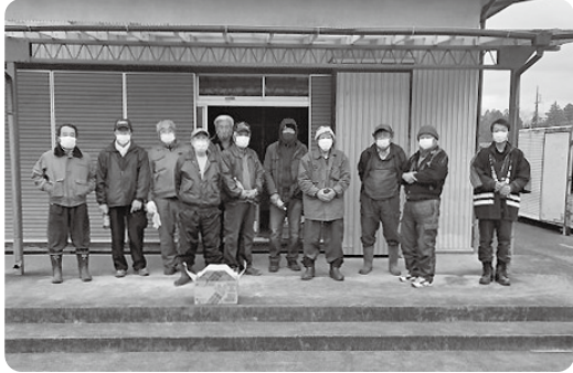
自主防災組織「上砂自主防災会」のメンバー

自然災害が猛威を振るう近年、「自分たちの安全は自分たちで守る」という気運の高まりがあり、区内でも平成27年に「上砂自主防災会」が結成されました。自主防災会の主な活動として、防災訓練や炊き出し訓練のほか、自然災害全般に対する知見を深めるための勉強会なども実施されています。また、定期的な資材の点検や、区内の危険箇所