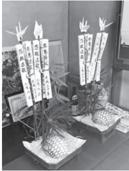
御武謝の祭壇の様子