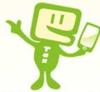
国税庁e-Taxキャラクター イータ君