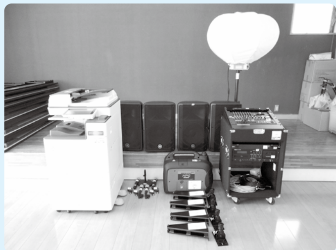
音響機器・投光器・発電機など