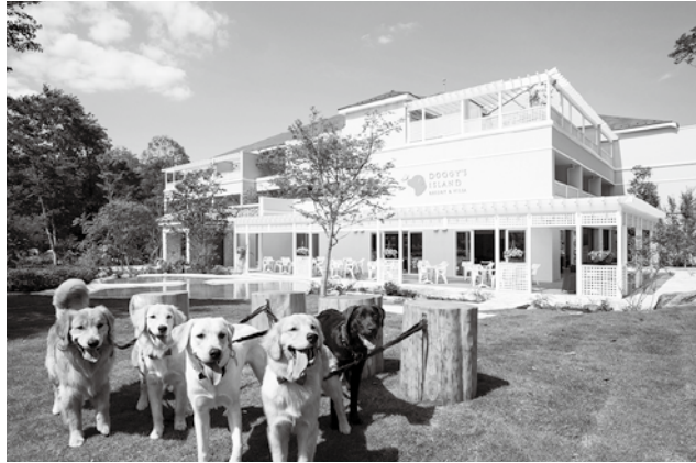
区内にあるリゾート施設 「小谷流の里ドギーズアイランド」