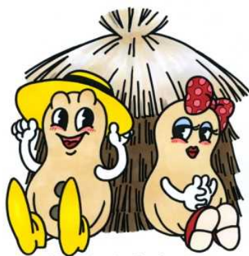
「ヒーちゃん ナっちゃん」©八街市