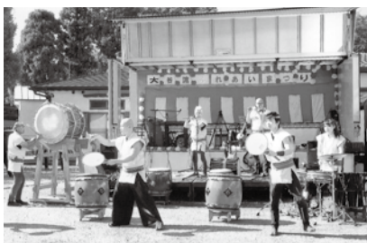
楽しい 大谷流ふれあい祭り