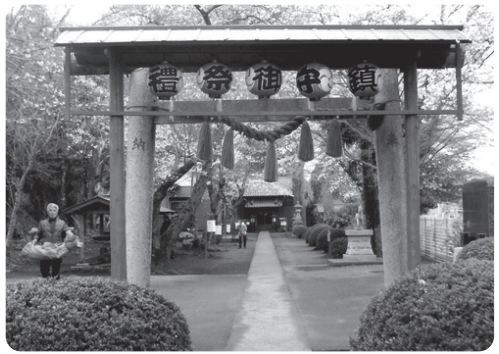
区南部にある小間子馬神社