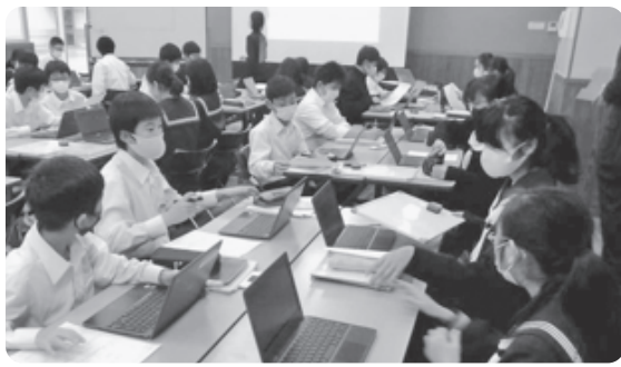
皆さんの貴重な税金を活用し、1人1台に貸与されたタブレット型パソコンで協働学習する中学生

(10月・12月は月末の日曜日でない場合があります) 午前8時30分～午後5時 夜間窓口開設日 毎週火曜日