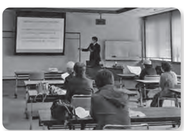
3月20日(土)に開催した健診の結果説明会の様子

融資利率 1年以内 年2・5% ↓ 年2・2% 2年以内 年2・8% ↓ 年2・5%