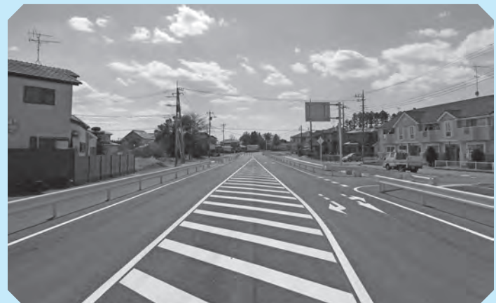
ボウリング場方面