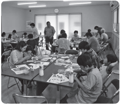
令和元年度に開催した絵手紙講座の様子