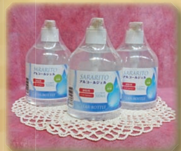
たくさんの方からマスクや消毒液などのご寄付を いただきました。ありがとうございました。

新年おめでとうございます。市民の皆さまにおかれましては、輝かしい新春をお迎えのことと、心からお喜び申し上げます。昨年、新型コロナウイルス感染症の大流行により、市民生活や経済活動に大きな影響が及ぶとともに、市民の皆さまには多くのご不便をおかけしました。緊急事態宣言に伴う外出自粛などの対策により、一旦、落ち着いたかにみえた新型コロナウイルス感染症でございりますが、再び全国各地で感染が拡大し、今も予断を許さない状況でございます。 今回、改めて私たちが社会生活を営むなかで、当たり前だと思っていた日常がいかに大切なものか、あり、また、もろいものなのかということを認識する機会となりました。そして、普段はあまり意識をしていなくても、一人ひとりが社会の構成員であり、その行動には責任が伴うことを教えられました。外出自粛や感染防止対策の要請に対し、市民の皆さまは協力すること、その責任に添えてくださりましたこと、ここに改めて、お礼と感謝を申し上げます。 しかし、新型コロナウイルスとの戦いはこれで終わりではありません。市民の皆さまにおかれま