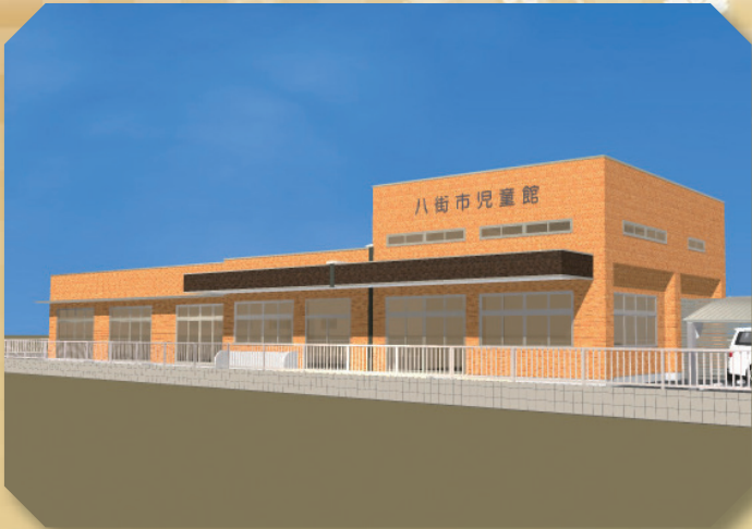
4月オープン予定の八街市児童館 (完成予定図)

人口の動き 12月1日現在 人口68,769人(前月比+134人) 男35,173人女33,596人世帯数32,118世帯