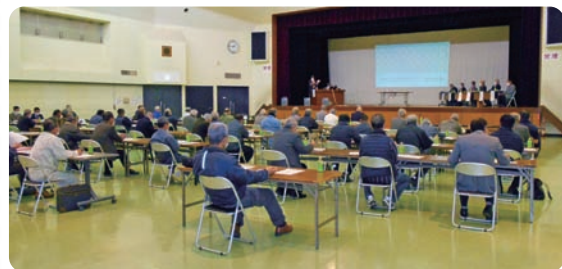
令和2年11月に「自主防災組織の活動について」をテーマとして開催した八街市区長会勉強会の様子