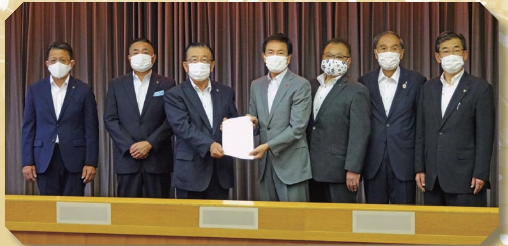
印旛都市首長会が新型コロナウイルス感染症の 拡大防止に向けた緊急要望書を千葉県へ提出