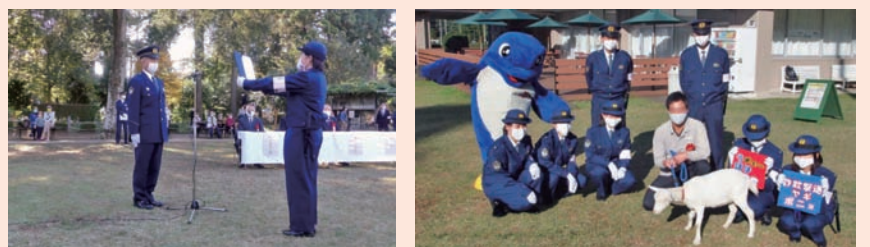
チーム「さくら」の結成式

チーム「さくら」に関する問い合わせ先 佐倉警察署チーム「さくら」事務局 ☎ 484-0110 (内線291)