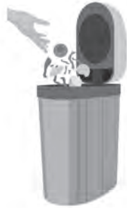
電気式生ごみ処理機