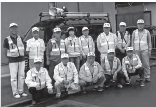
防犯パトロール隊のメンバー