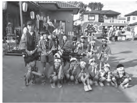
納涼盆踊り大会の様子

2月に行った防災訓練では、震度5以上の地震を想定して、各町内会ごとに集会所を設け、各町内会長や組長が集まる場所へ集まり、本部の指令のもと、安否確認と物資の配布をしました。