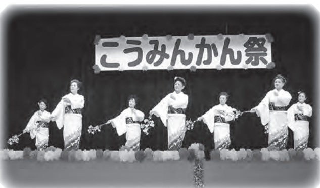
前回のこうみんかん祭の様子