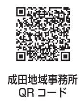
成田地域事務所 QRコード

☎自衛隊千葉地方協力本部成田地域事務所 0476-22-6275 自衛官募集ホームページ https://www.mod.go.jp/gsd/jieikanbosyu/