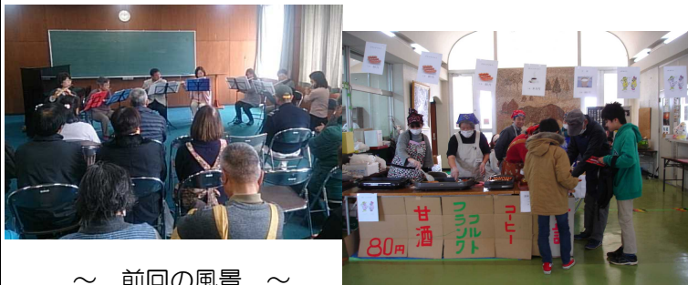
～ 前回の風景 ～

そば、手作り品などの販売(数には限りがあります) 焼きそば、カレーライス、豚汁、フランクフルト、コーヒーなど