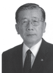
八街市長 北村 新司

児童・生徒の皆さん、もうすぐ平成27年度も終わりに近づき、春休みも間近です。これから春本番を迎え、桜の開花とともに卒業式、そして入学式の季節になり、皆さんもまた一つ大人に近づきます。