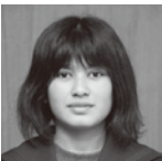
タイムファーマ ミズヤ 議長 (八街中2年)

今回で2回目の参加となりましたが、昨年と比較して感じたのは、質問に対する答弁がより具体的に納得できるものであったことです。その背景には市長さんをはじめ市役所の方々の誠意と頑張りを感じられました。