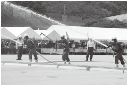
▲ポンプ車の部に出場した第1分団