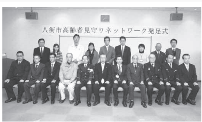
八街市高齢者見守りネットワーク発足式

郵便・宅配・電気・ガス 水道事業者、新聞・牛乳 販売店、民生委員児童委員 協議会などの協力により、 日常生活の中で、地域の高 齢者に対し、さりげない見 守りを行い、「ポストに郵便 物がたまっている」「洗濯 物が何日も干しっぱなし」 などの異変を発見した時、 市へ連絡をいただき、市が 状況確認を行うものです。 市民のみならずも地域の 高齢者への見守りにご協力 いただき、何らかの異変を 発見した時は、市へ連絡を お願いいたします。 ※ネットワークに参加して いる事業所名などは市ホー ムページに掲載しています。