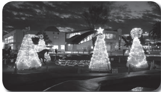
昨年のペットボトルライトアップツリー展示の様子