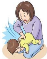
図3: 背部叩打法 (乳児)