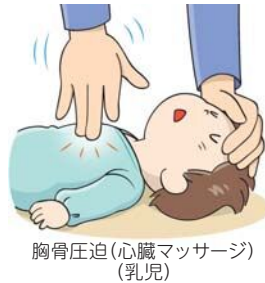
胸骨圧迫(心臓マッサージ) (乳児)