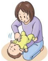
図4: 胸部突き上げ法 (乳児)