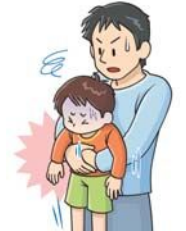
図2: 腹部突き上げ法 (幼児)