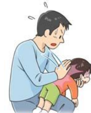
図1: 背部叩打法 (幼児)