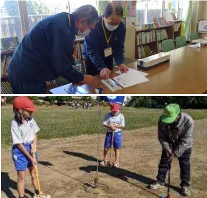
(上) 八街東みらい塾 (下) 交進みらい塾活動の様子

学校だけではなく市や地区社会福祉協議会などと連携しながら、「メンバー自身はもちろんです、いかに子どもたちを楽しんでもらうか」を大切に活動しています。